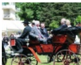
Investor Day стартовал в Вильнюсе. Так участники добирались на чемпионат мира по конкуру

был представлен годовой отчет о работе фонда, а в Казани они посетили региональные представительства портфельных компаний фонда и встретились с членами правительства Республики Татарстан — премьер-министром Рустамом Миннихановым и министром экономики Маратом Сафиуллиным.