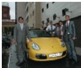
Главный приз для лучшего консультанта 2008 года

мероприятия. А по итогам года будет объявлен победитель в личном зачете, который получит главный приз — Porsche Boxter. На зависть всем прохожим престижное авто уже ждет своего будущего обладателя у входа в офис Тройки Диалог на Красной Пресне. Кто же им станет, мы узнаем очень скоро — на общем годовом собрании в ноябре.