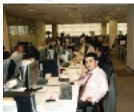
Теперь на Красной Пресне работает команда из ста консультантов

(страхование, финансовое планирование и т.д.). В Москве в рамках этого объединения отдел по работе с частными клиентами, который ранее находился в составе Capital Markets, переехал в офис на Красной Пресне. Теперь там в общей сложности работает почти 100 консультантов, которые обеспечивают наших частных клиентов всеми услугами Тройки.