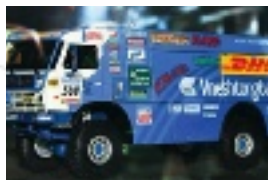
КАМАЗ — лидер продаж грузовых автомобилей в России с долей рынка 30%

производства и продаж. Daimler является мировым лидером в производстве грузовиков и, безусловно, сможет привнести в производство КАМАЗа свои технологические ноу-хау, а КАМАЗ, в свою очередь, поможет компании Daimler выйти на российский рынок.